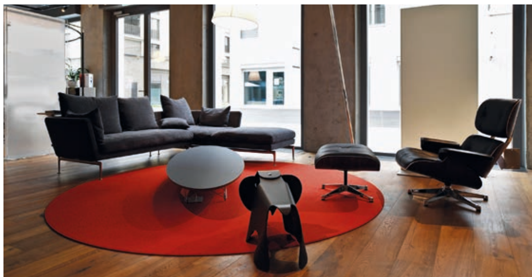
Sitzgruppe aus dem «Immo-Staging.ch Angebot» in der 3'000 m 2 grossen Ausstellung in der «Aeschbachhalle 6» Aarau.